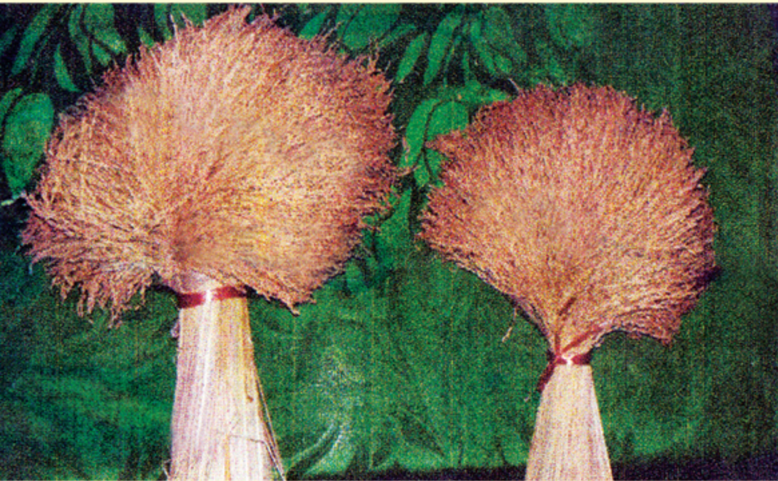
ခေါင်နွံ(၅၀၀) → ခေါင်နွံ(၂၅၀)